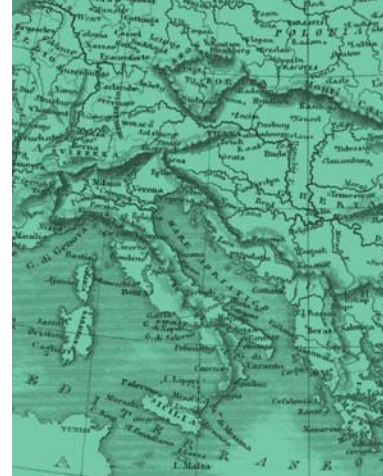
TAVOLA 2c: MERCATO DEL LAVORO