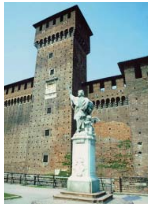
“Castello Sforza” (XV sec.) – Milano