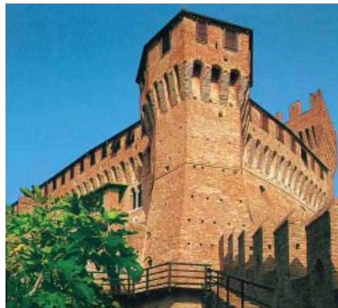
La Rocca di Gradara (XII-XV sec.) – Pesaro