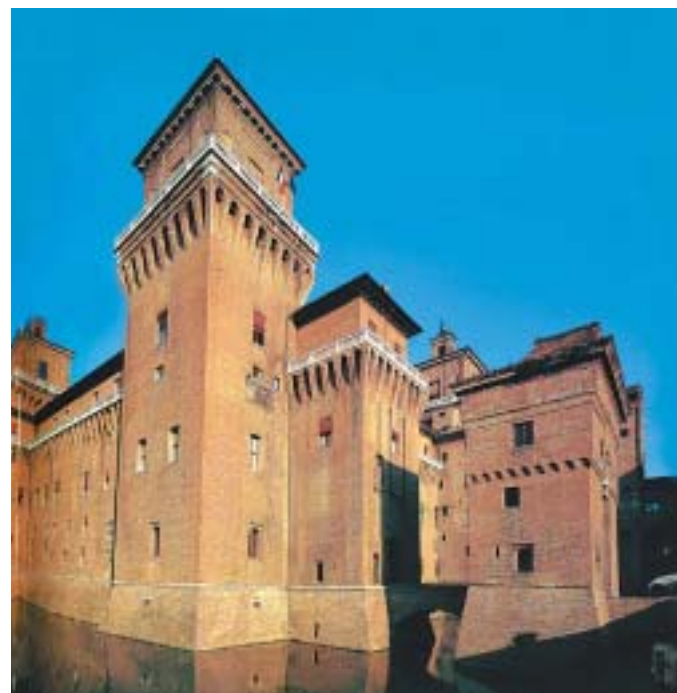
Castello Estense (1385-1395) – Ferrara