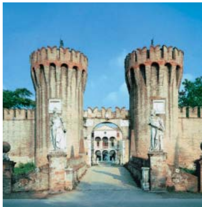
Il Castello di Roncade (XV sec.) – Treviso