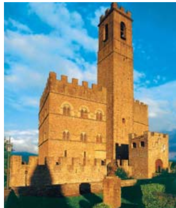
Il Castello dei conti Guidi (1274-1291) Poppi – Arezzo