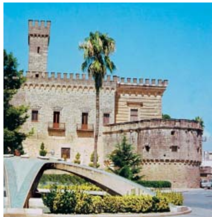
Il Castello di Nardò (XV-XVI sec.) – Lecce