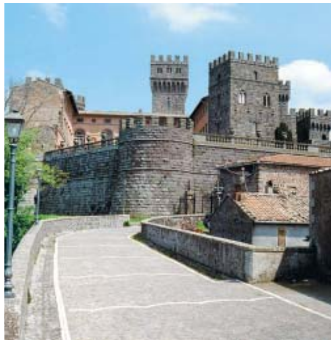
Castello di Torre Alfina (XIV sec.) – Viterbo