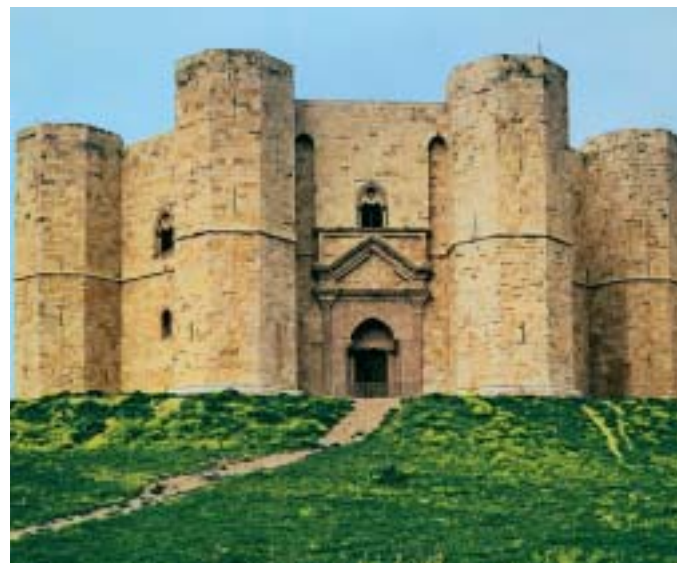
Castel del Monte (1240-1250) – Bari