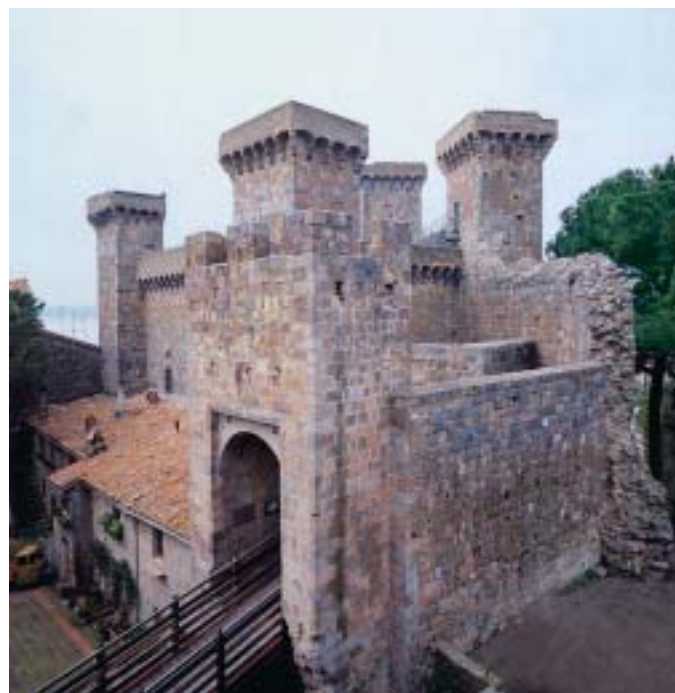
Il Castello dei Monaldeschi (1295) – Bolsena (VT)