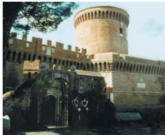
Il Castello di Ostia Antica (1483-1486) – Roma