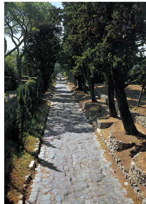
Roma: Via Appia Antica