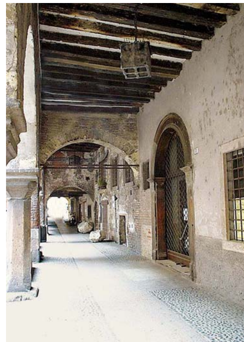
Verona: Via Sottoriva