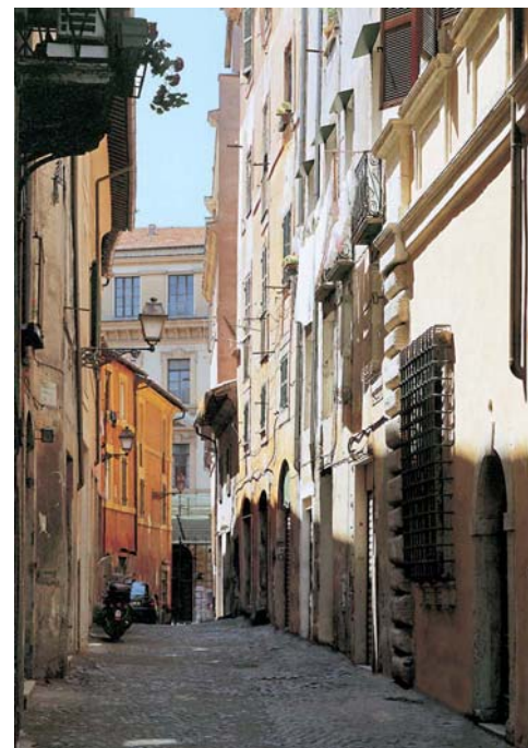
Roma: Via della Reginella