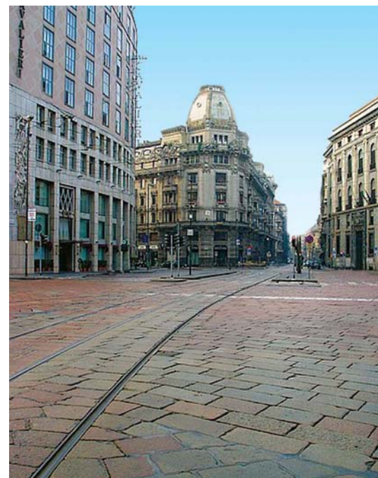
Milano: Corso d'Italia