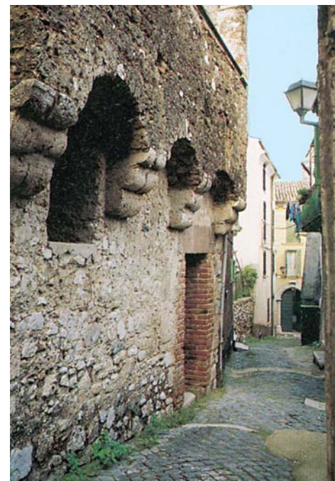
San Giovanni Incarico (Frosinone)