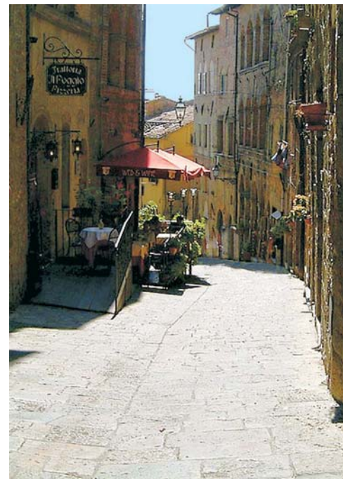
Volterra: Via Porta all'Arco