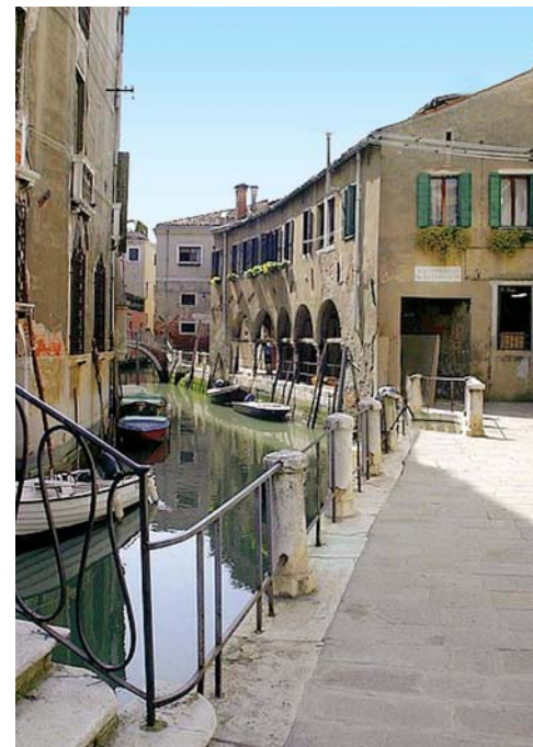
Venezia: Vicolo di Cannareggio