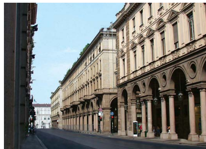
Torino: Via Roma