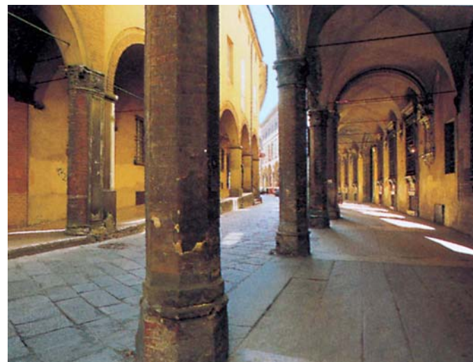
Bologna: I Portici