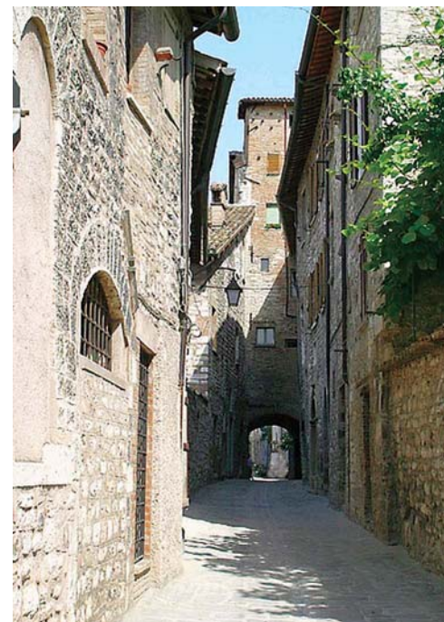
Gubbio: Vicolo del Centro Storico