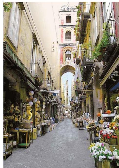
Napoli: Via San Gregorio Armeno