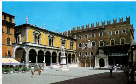
Piazza dei Signori - Verona