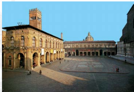
Piazza Maggiore - Bologna