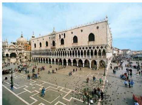
Piazzetta S. Marco – Venezia