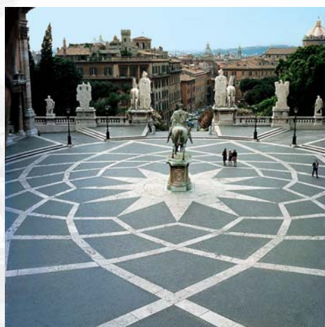
Piazza del Campidoglio – Roma