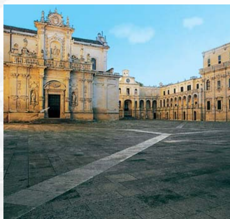
Piazza del Duomo – Lecce