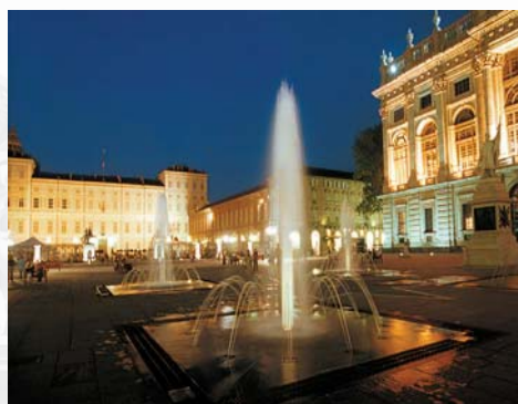
Piazza Castello - Torino