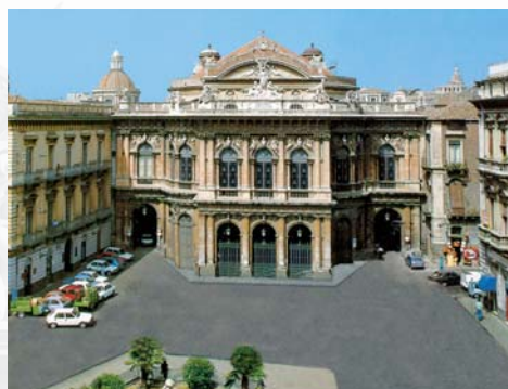
Piazza Bellini - Catania