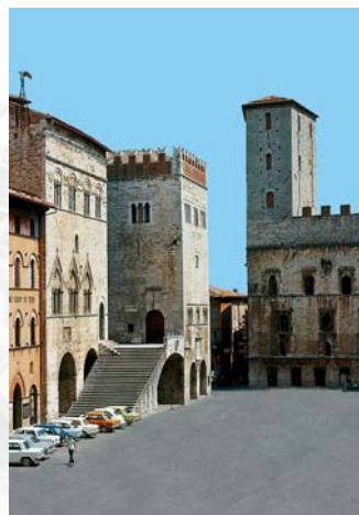
Piazza del Popolo – Todi