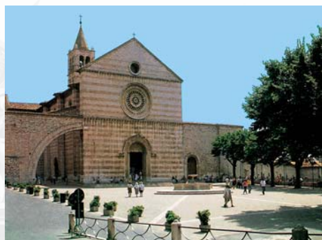
Piazza S. Chiara - Assisi