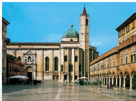
Piazza del Popolo – Ascoli Piceno