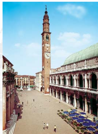
Piazza dei Signori - Vicenza