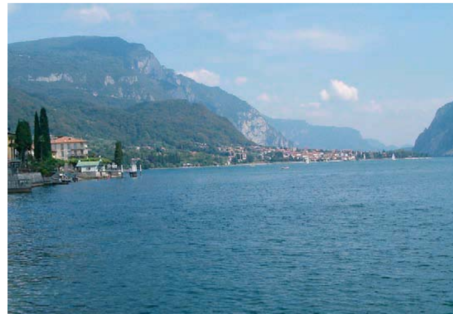
Lago di Como - Lombardia