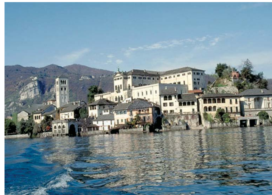
Lago Maggiore - Piemonte