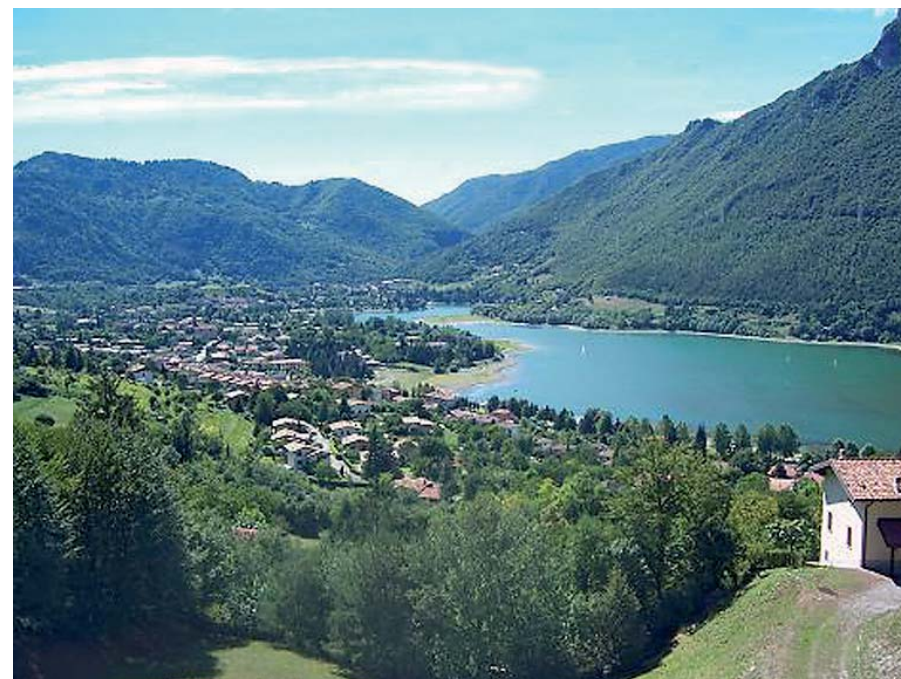
Lago di Idro - Lombardia