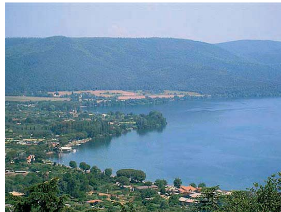
Lago di Bracciano - Lazio