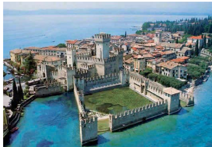
Lago di Garda - Veneto