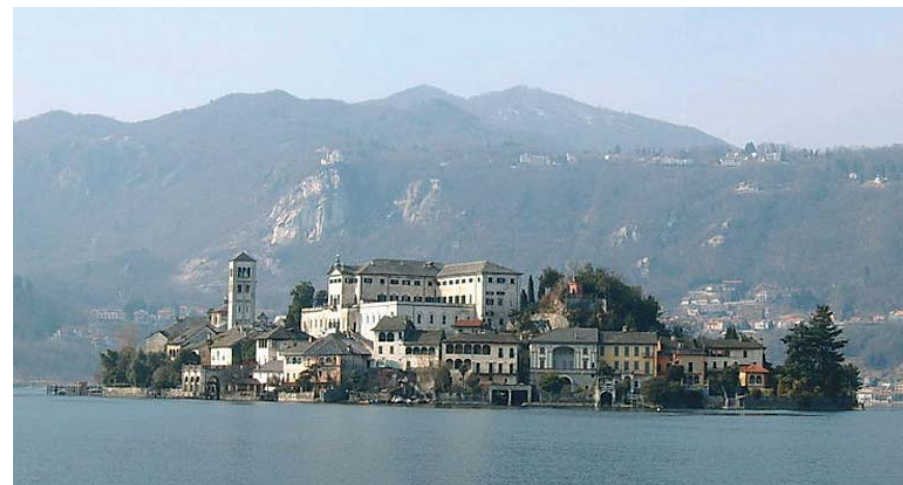
Lago d'Orta - Piemonte