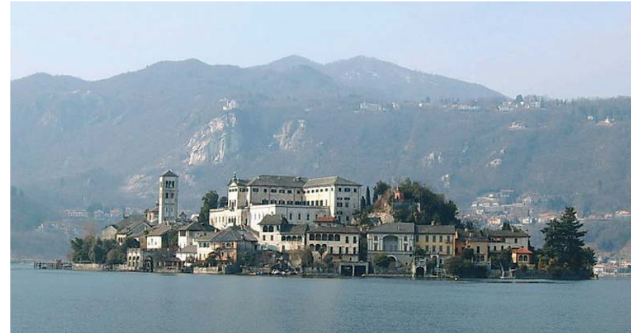
Lago d'Orta - Piemonte