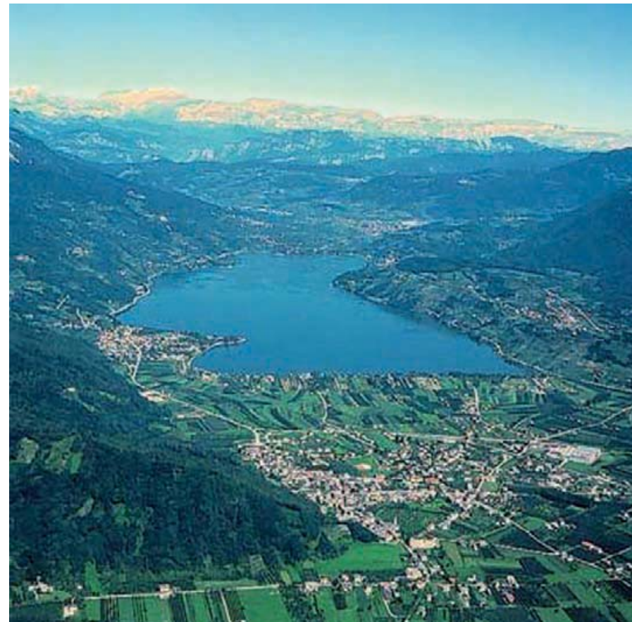
Lago di Caldonazzo - Trentino Alto Adige