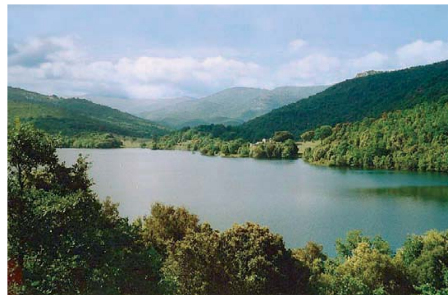
Lago di Gusana - Sardegna