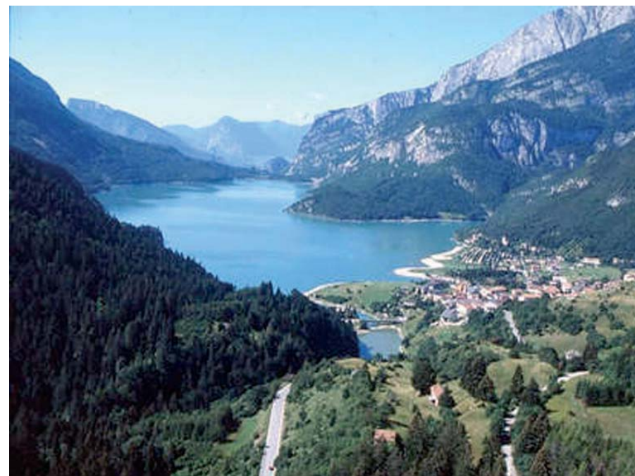
Lago Molveno - Trentino Alto Adige