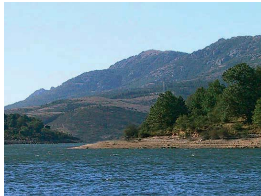
Lago di Flumendosa - Sardegna