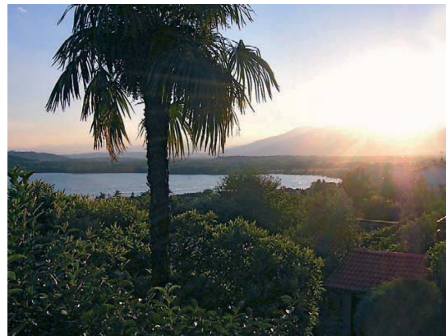
Lago di Viverone - Piemonte