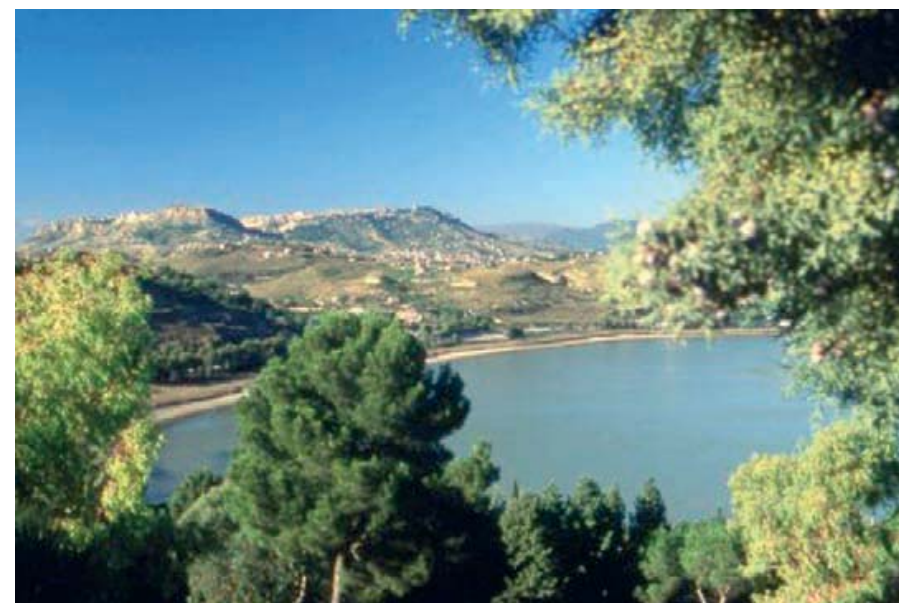
Lago di Pergusa - Sicilia