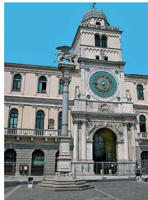
Padova: Palazzo del Capitano - Arco dell'Orologio