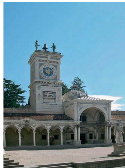
Udine: Torre dell'Orologio