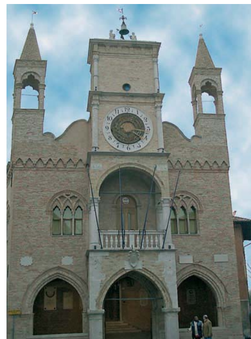
Pordenone: Palazzo del Comune