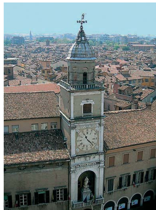
Modena: Torre dell'orologio