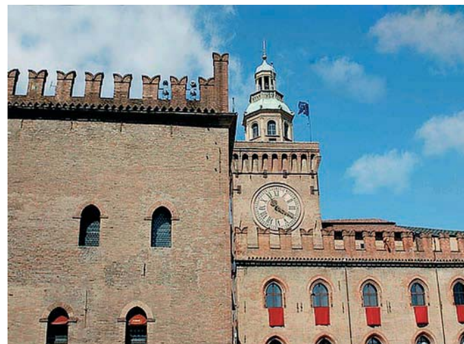
Bologna: Torre degli Accursi