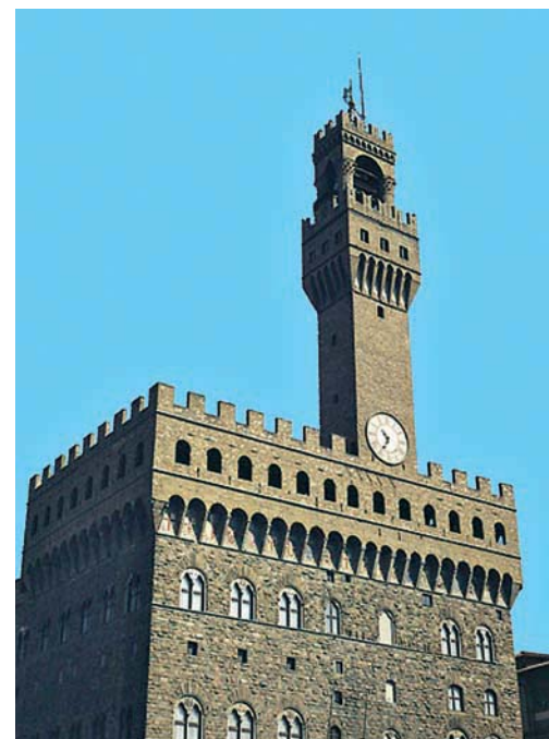
Firenze: Palazzo della Signoria