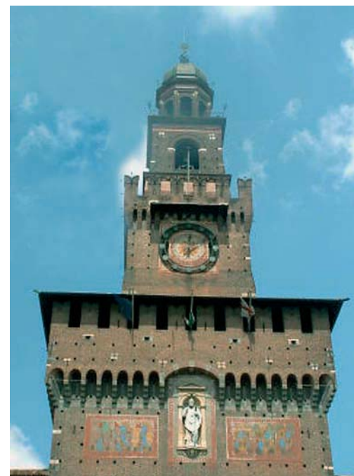
Milano: Castello Sforzesco