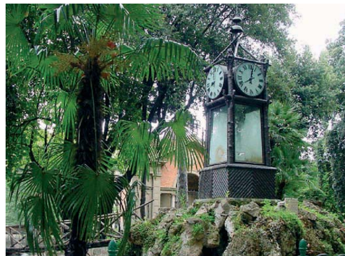
Roma: Orologio ad acqua del Pincio