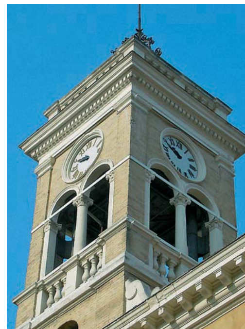
Cupramarittima (AP): Torretta dell'Orologio