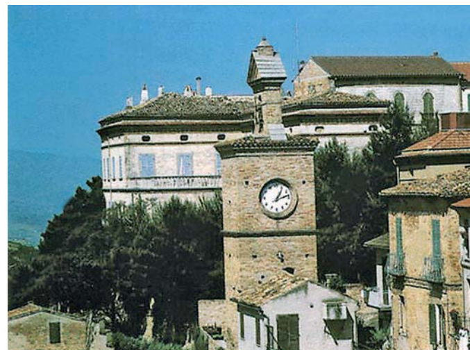
Colonella (AP): Torre dell'orologio